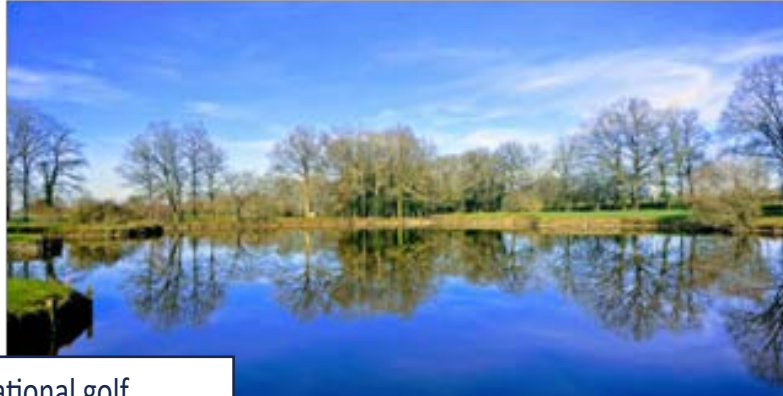
Golf du Domaine des Forges

Challenge national golf Poitiers (86) du jeudi 09 mai au dimanche 12 mai 2024 (4 jours/3 nuits)